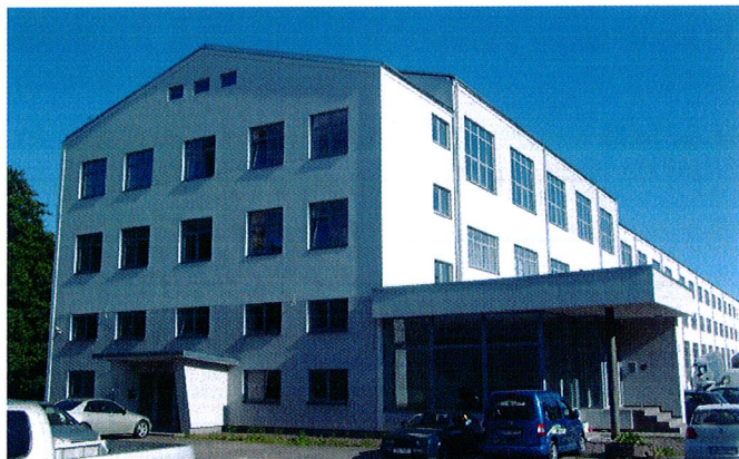
2. attēls. Pašreizējā teritorijas izmantošana – Biroja ēka.

Detālplānojuma izmaiņu teritorija ir apbūvēta, uz tās izvietota biroju ēka, kas ir 18 m augsta (skatīt attēlu nr. 2.)