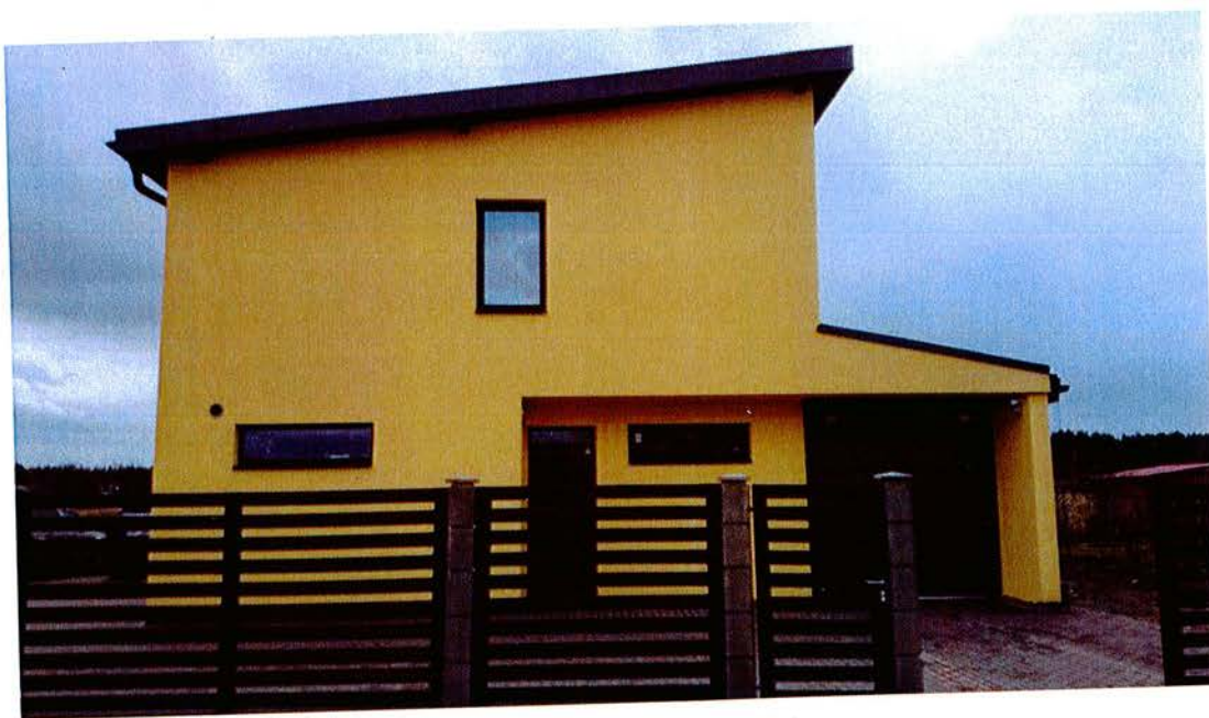
1.attēls. Skats uz dzīvojamo ēku Domenikas ielā 3 no Domenikas ielas puses.

Detālplānojuma grozījumi paredz grozīt tikai detālplānojumā noteikto būvlaidi gar Domenikas ielu zemes vienībā Domenikas ielā 3, to samazinot no plānotajiem 6 metriem līdz 5 metriem. Minētie grozījumi veikti ievērojot Ministru Kabineta 2013.gada 13.aprīļa noteikumu Nr.240 „Vispārīgie teritorijas plānošanas, izmantošanas un apbūves noteikumi” 130.2.apakšpunkta nosacījumus, kas nosaka: „ Apbūves teritorijās, starp ielas sarkano līniju un būvlaidi vietējas nozīmes ielām, piebrauktuvēm, gājēju ielām un ceļiem ievēro minimālo attālumu, kas nav mazāks kā 3 m ”, un saskaņā ar spēkā esošā Ķekavas novada Ķekavas pagasta teritorijas plānojuma 2009.-2021.gadam teritorijas izmantošanas un apbūves noteikumu 88.11.apakšpunktu, kas nosaka, ka priekšpagalma minimālais platums (būvlaide) pie vietējas nozīmes ielām ir 4 metri. Detālplānojuma grozījumos noteiktās būvlaiides ir uzrādītas ar piesaistēm (attālumiem) no zemes vienības robežām un ielu sarkanajām līnijām, kas attēlotas detālplānojuma grozījumu grafiskās daļas lapā Nr.1 „Teritorijas plānotā (atļautā) izmantošana un apgrūtinājumu plāns”. Detālplānojuma grozījumos ir precizēti esošie zemesgabala apgrūtinājumi, nosakot visas aizsargjoslas atbilstoši Aizsargjoslu likuma prasībām.