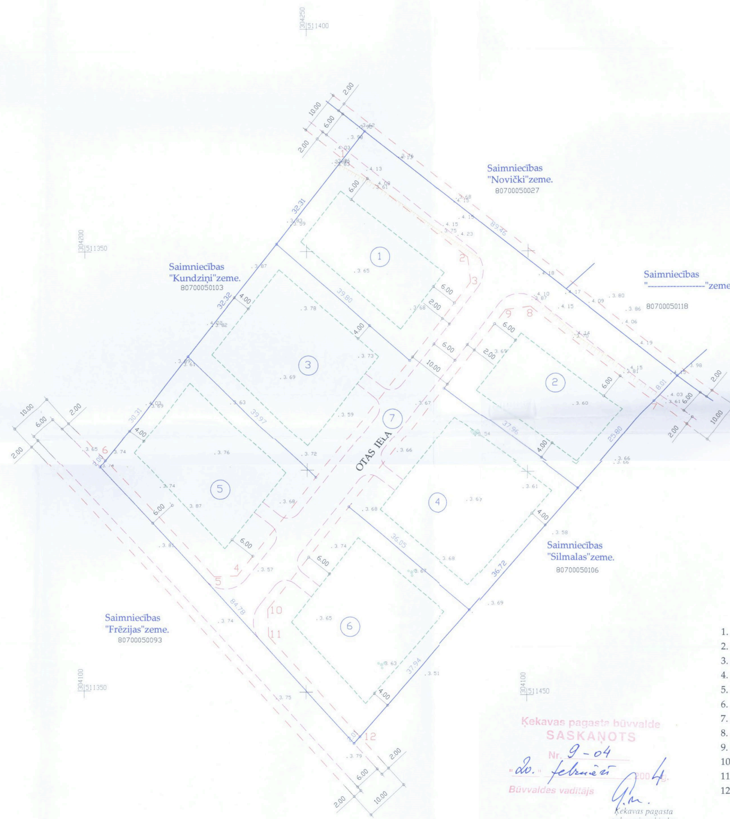
Sarkano līniju koordinātes