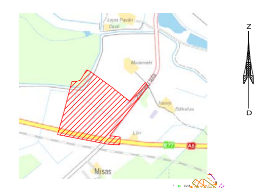
Objekta izvietojuma shēma