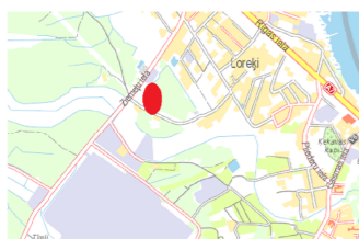
Uzmērītās teritorijas novietojuma shēma